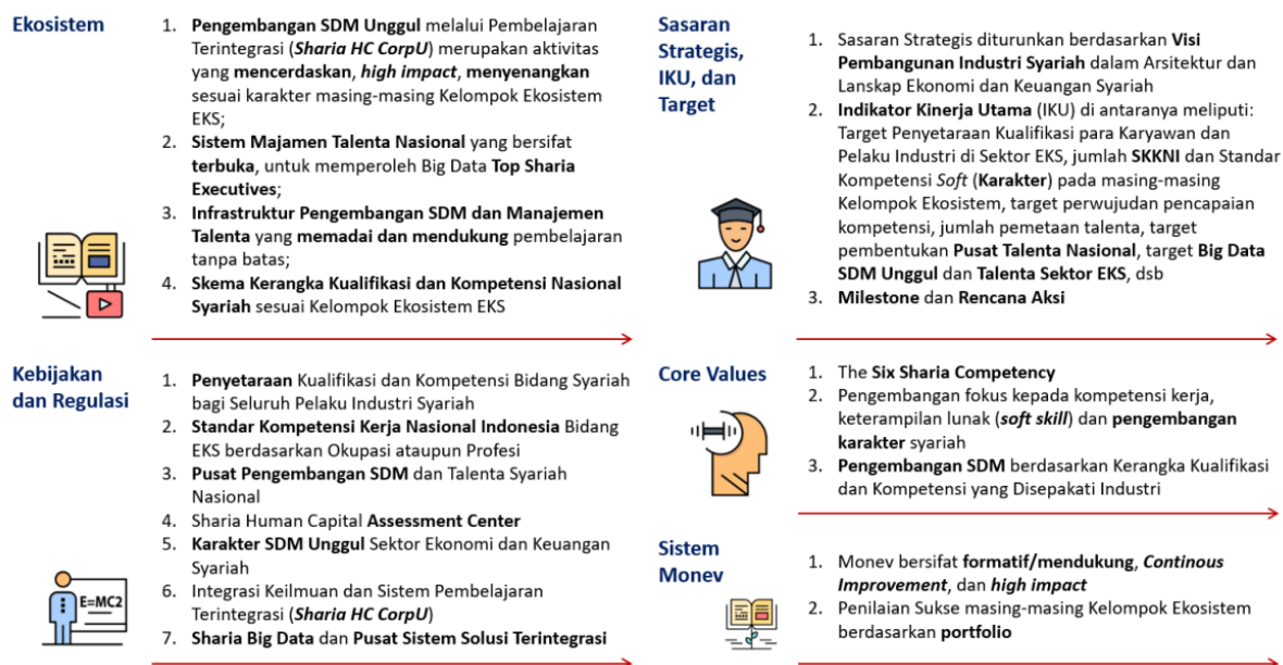
Figur 2.3. Komponen Strategis Pembangunan SDM Unggul dan Talenta EKS