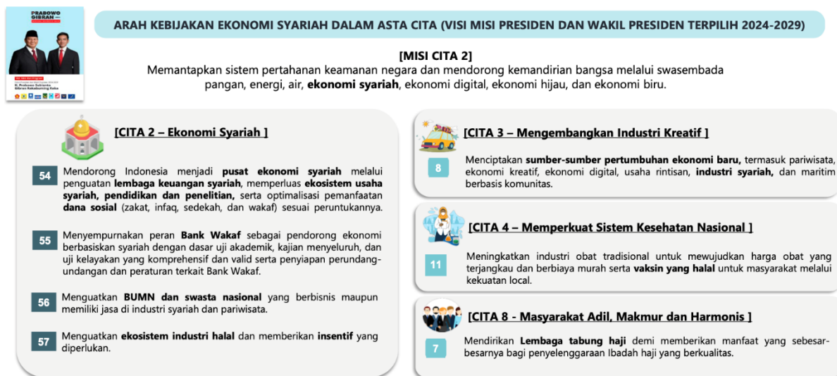
Figur 5.1. Asta Cita dan Positioning Ekonomi dan Keuangan Syariah

Dalam hal ini, ekonomi dan keuangan syariah melalui berbagai sektor dan instrumennya diharapkan mampu meningkatkan kapasitasnya dalam mendorong kemandirian bangsa terutama dalam hal kemandirian secara ekonomi yang menjadi salah satu agenda pembangunan pemerintahan baru. Asta Cita juga secara tegas mengarahkan sektor-sektor EKS yang secara spesifik akan memainkan peran. Sektor yang secara eksplisit disebutkan dalam Asta Cita adalah keuangan sosial syariah (bank wakaf), keuangan haji, industri farmasi halal (untuk vaksin halal), dan industri halal secara umum (dalam hal peningkatan kualitas ekosistem dari hulu ke hilir).